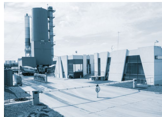
Бетонный завод 223